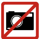
Foto- und Filmaufnahmen durch Kongress-Teilnehmer und Referenten

Ein Widerruf Ihrer Einwilligung ist vor Ort bei der Registrierung möglich; es wird Ihnen dann eine Kennzeichnung ausgehändigt, die Sie während der gesamten Veranstaltung sichtbar zu tragen haben. Bitte tragen Sie aber auch selbstständig dafür Sorge, nicht im abgelichteten Bereich zu stehen und halten Sie sich bei Aufnahmen am Rand auf.